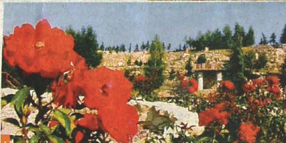
Takhle květla zahrada již vloni

líčko klidu a pohody se nachází blízko Letiště Václava Havla.